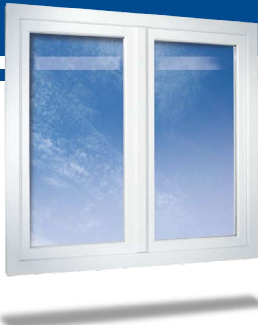
2-flügeliges Fenster in flächenversetzter Variante